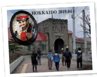
2019年4月には社員旅行で北海道へ行きました!